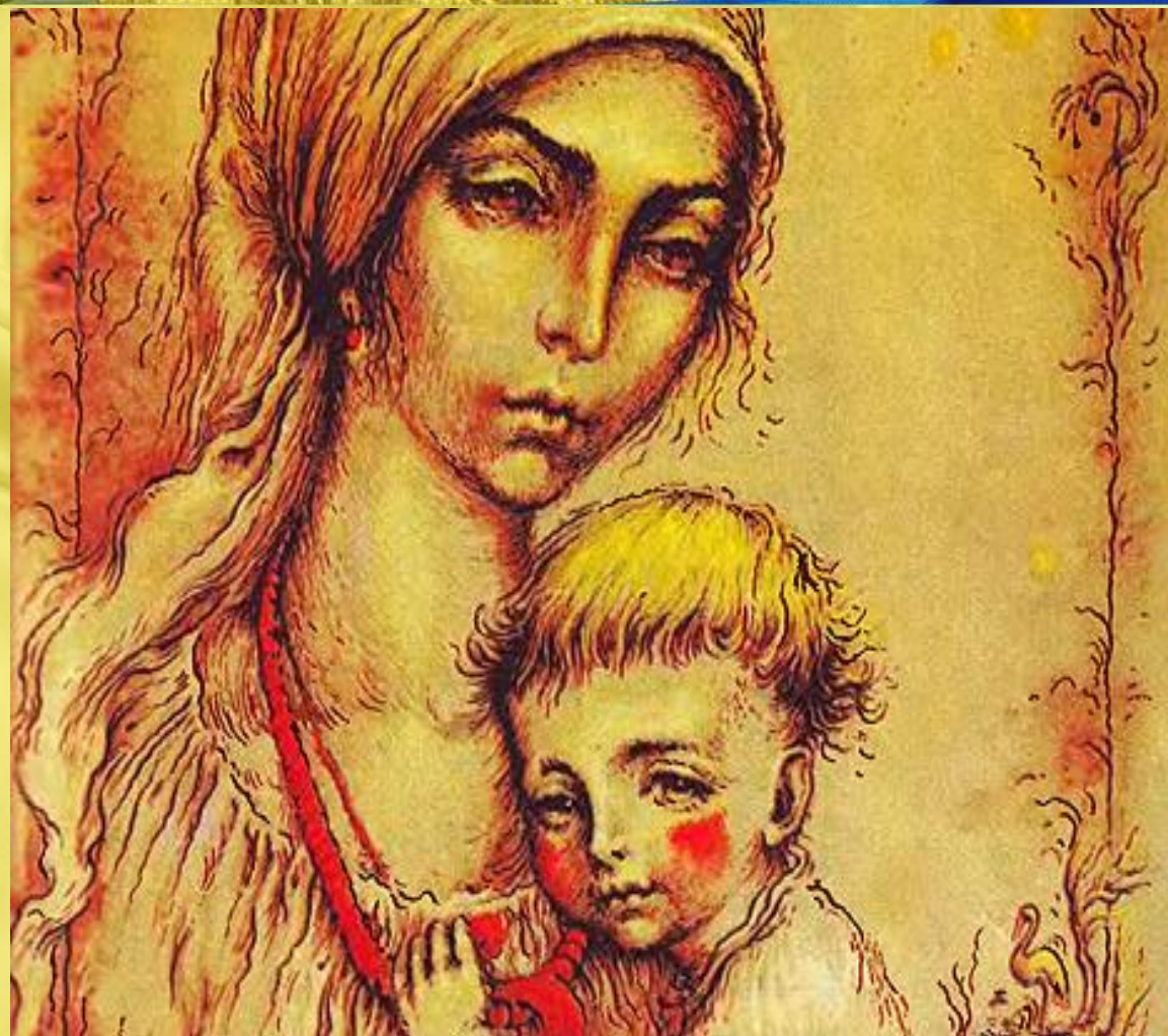
Репродукція картини Т.Шевченка "Наймичка"