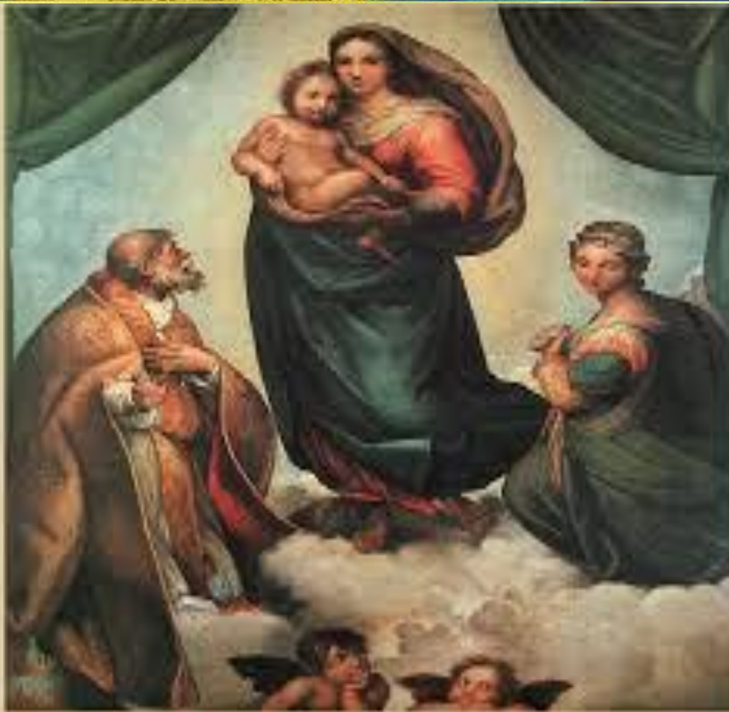
Картина Рафаеля “Сікстинська Мадонна”