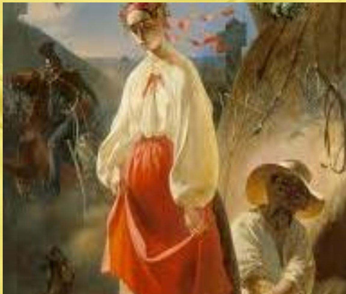
Репродукція картини Т.Шевченка “Катерина”