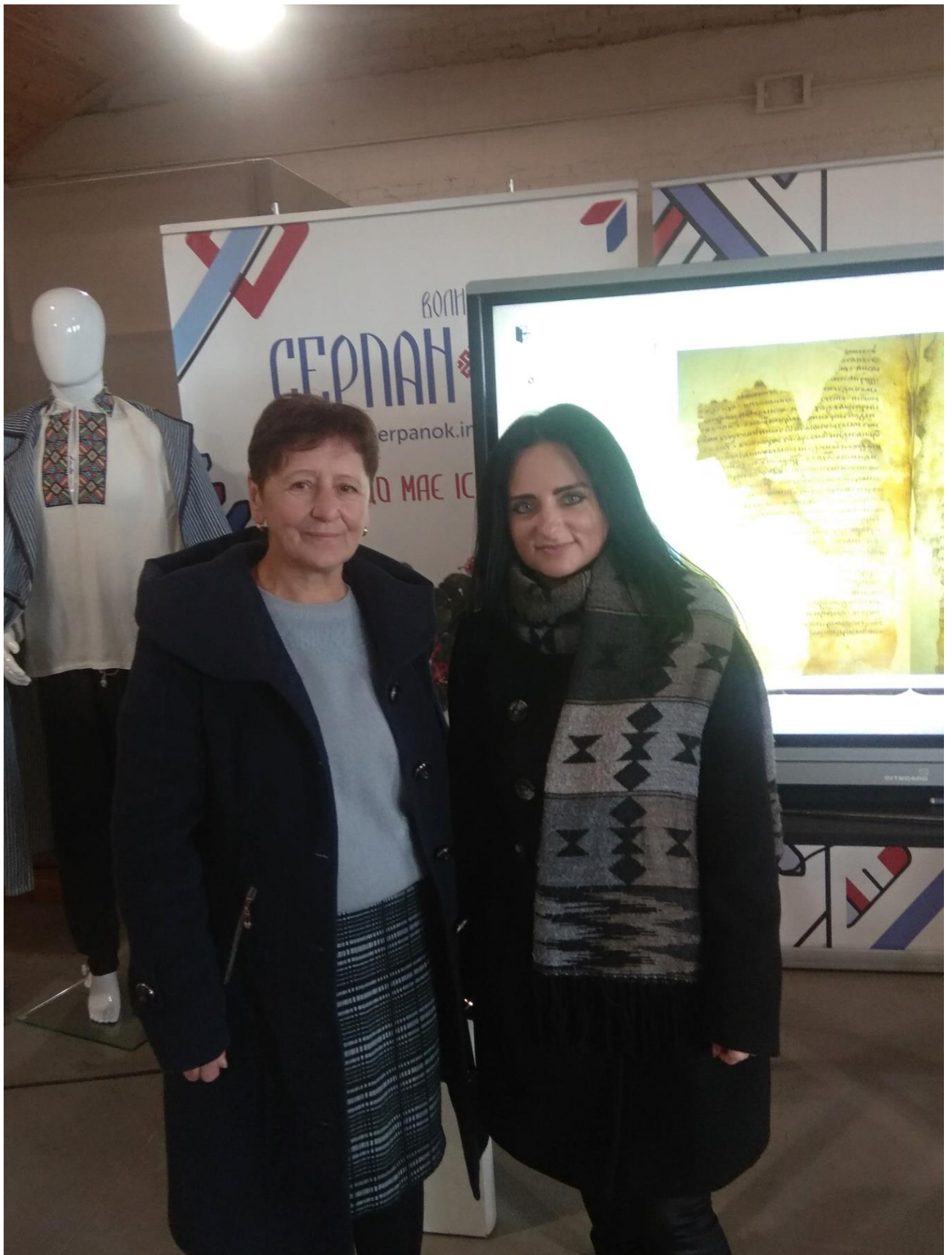
Вчителі взяли участь у яскравому флешмобі з нагоди Дня української хустки, покликаного об'єднати жінок різних професій, віку та національностей для збереження українських традицій.